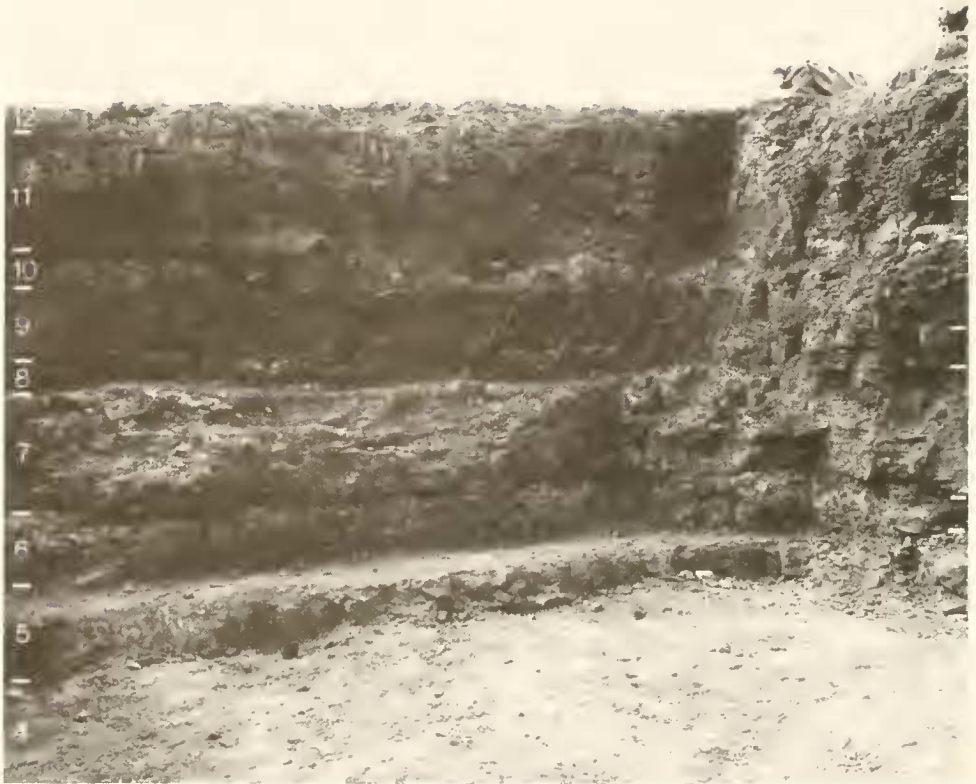
Abb. 4: Grabungsstelle nach Abschluß der Arbeiten im September 1986. Erschlossen waren Mittelbajoc bis Untercallov. Banknummern nach KOLB (1965). Profilhöhe (Bank 5–12): 2,20 m.

beginnt sie „an der Grenze untere – obere Humphriesi-Schichten und dauert das ganze obere Mittel- \delta an“. PAVIA (1983, 118) führt die Art aus der blagdeni -Subzone an. Ähnliches stratigraphisches Alter ist für Chondroceras cf. wrighti minor anzunehmen. Der Holotypus der Unterart stammt nach WESTERMANN (1956, 61) aus der humphriesianum -Zone.